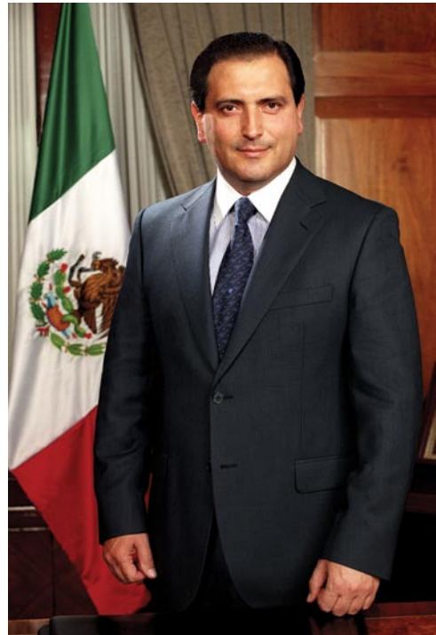
Ing. Luis Armando Reynoso Femat Governador Constitucional del Estado de Aguascalientes

Aguascalientes es grande por su gente y por sus logros que son de todos, ya que todos, sin excepción, dedicamos nuestros mejores esfuerzos a su fortalecimiento. Trabajamos arduamente en el campo, en las ciudades, en las fábricas,