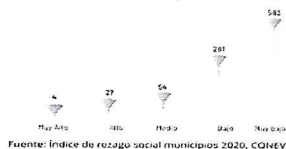
Ilustración 19. Grado de rezago social en localidades.