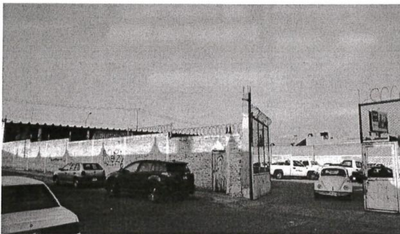
FOTOGRAFÍAS ACTUALES DEL INMUEBLE