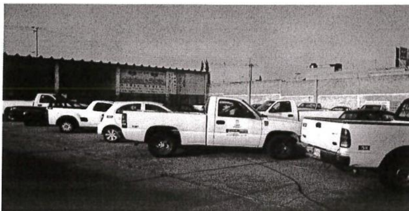
FOTOGRAFÍAS ACTUALES DEL INMUEBLE

CONTRATO NÚMERO: 019/2018-ARRENDAMIENTO- SEDRAE