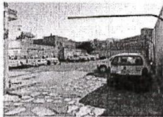
VISTA DE FONDO.