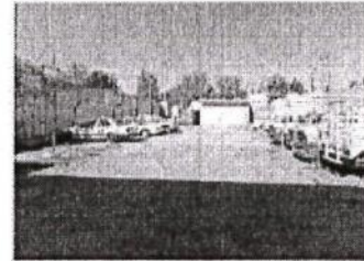
VISTA HACIA LA CALLE.